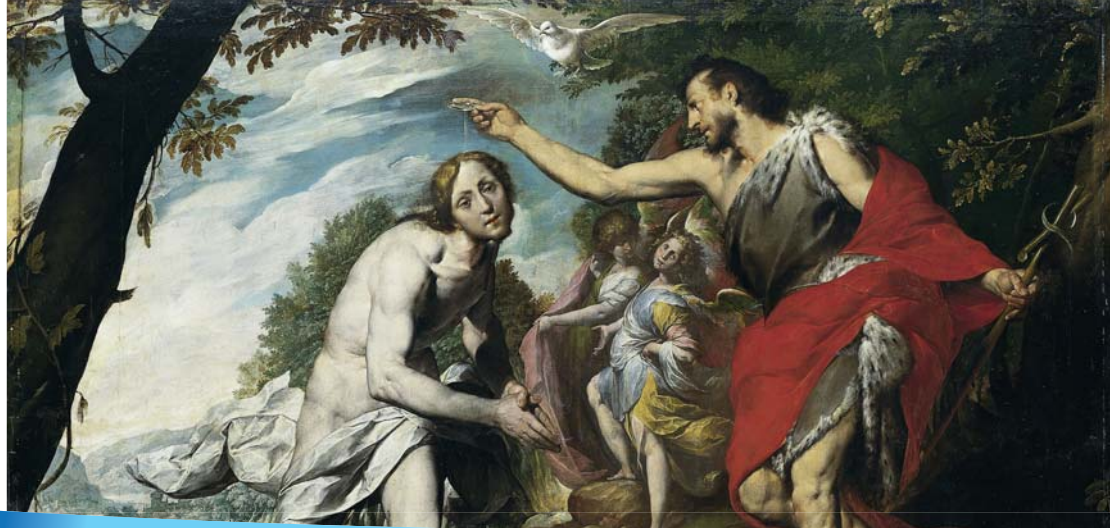
Хрост Пана Езуса ў Ярдане.