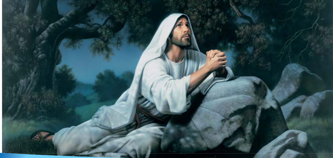
Малітва Езуса ў Аліўным садзе.