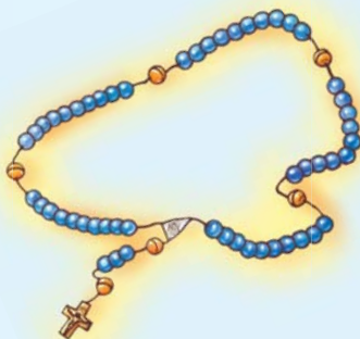
Набажэнства Святога Ружанца