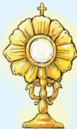
Адарацыя Найсвяцейшага Сакрамэнту