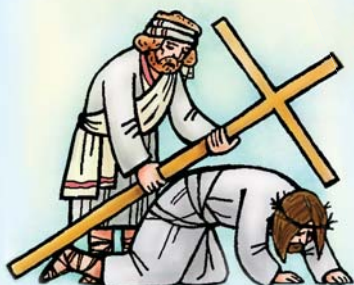
Набажэнства Крыжовага шляху

Прыклей пад малюнкамі адпаведныя подпісы (гл. наклеякі).